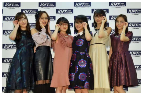
(2018年表彰式・個別記者会見光景)