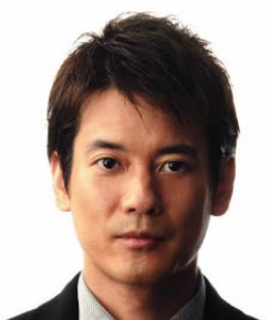
唐沢 寿明 (俳優)