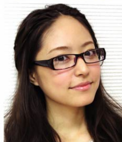
井上 真央 (女優)