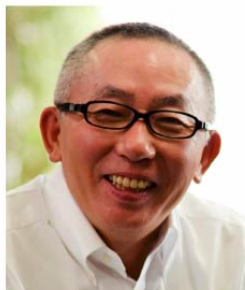
柳井 正 (株)ファーストリテイリング 代表取締役会長 兼 社長