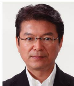
長妻 昭 (厚生労働大臣 年金改革担当)