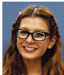
スザンヌ (タレント)